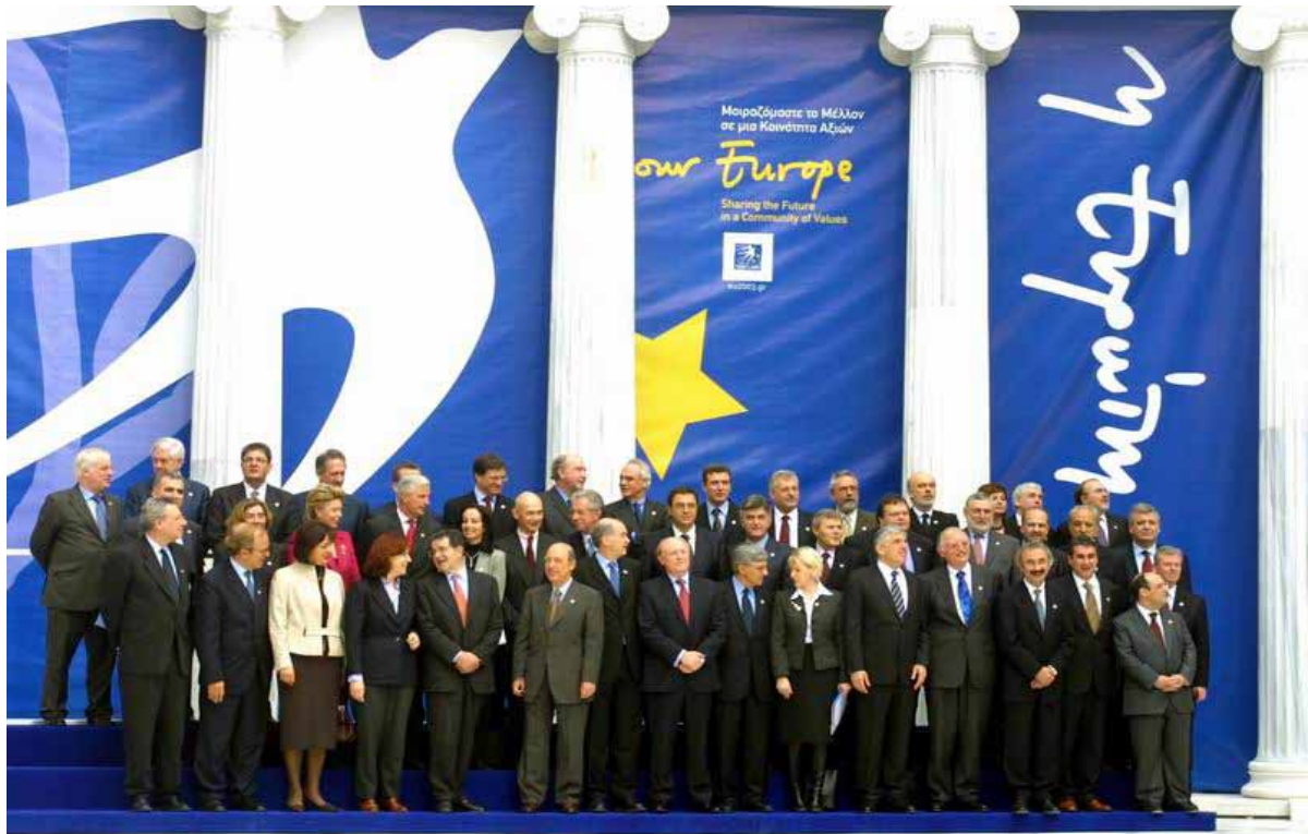
Οικογενειακή Φωτογραφία στην τελετή ανάληψης της Προεδρίας της Ευρωπαϊκής Ένωσης από την Ελλάδα. Ιανουάριος 2003